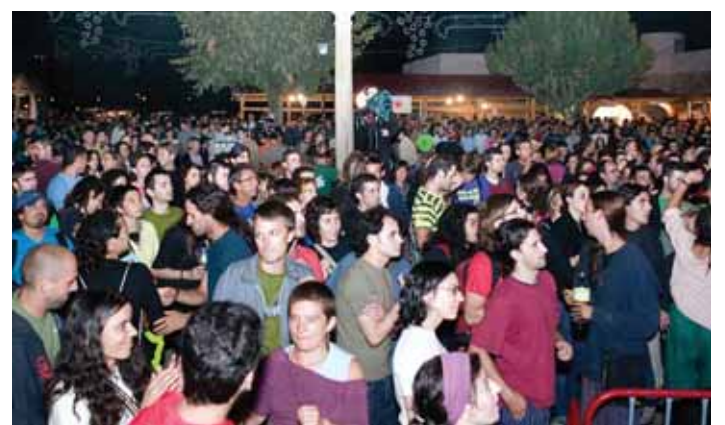
Imagens do Festival da Poesia de 2006