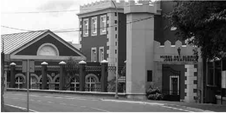
O Teatro das Torres acolherá as diferentes palestras organizadas polos centros sociais, a AGAL, o MDL e NGZ