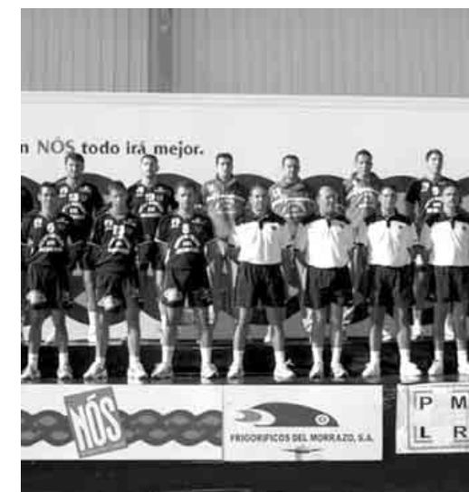
Com a descida do Clube Andebol Cangas-Frigoríficos do Morraço à Divisom de Honra B, a Galiza perde o seu último representante na categoria de ouro do andebol estatal

Junto com o Teucro, a Academia Octávio de Vigo foi a outra grande equipa do andebol galego. Foi em meados dos anos