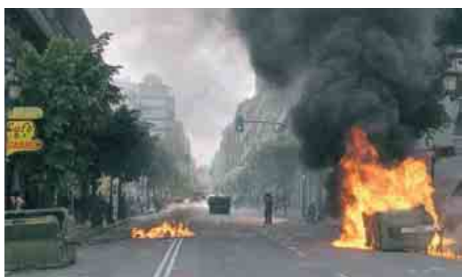
O centro de Vigo foi o cenário de enfrontamentos entre policía e obreiros