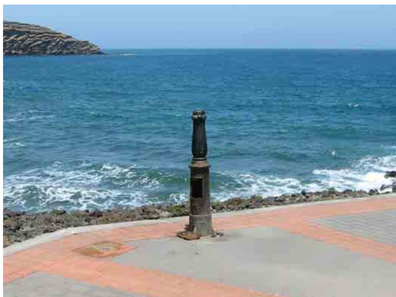
A proliferação de passeios marítimos e portos desportivos contribuem à degradação da riqueza costeira