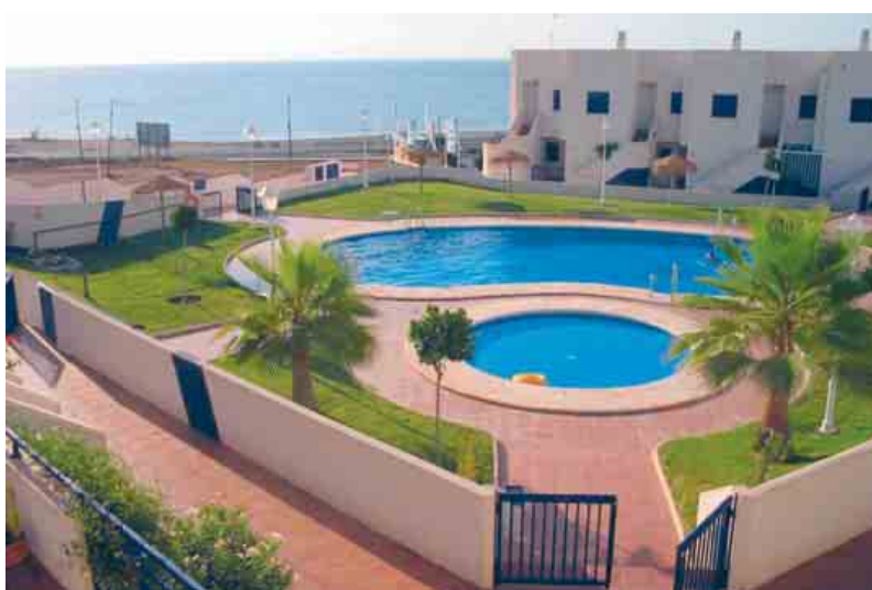
Interesses das imobiliárias primam sobre os da populaçom e o ambiente nas decisõs urbanísticas de muitas câmaras

Repórteres Sem Fronteiras cumpre o papel de vigilante dos interesses dos EUA e o sistema capitalista na âmbito da comunicaçom / 15