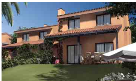
Na imaxe superior membros do Foro Social de Cangas protestan perante a sede da Autoridade Portuária. Em baixo, vivenda publicitada da urbanización Costa Anácar