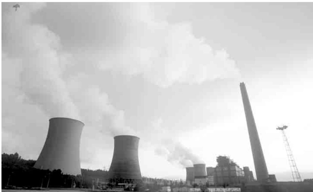
As centrais térmicas galegas -Endesa As Pontes na imagem- aglutinárom 75% dos direitos de emissom outorgados polo Plano Nacional de Assinaçom (PNA), ficando 25% restante para outros sectores, como refinado de petróleo, co-geraçom, cimenteiras, cerâmica, pasta de papel, metalurgia e vidro

As centrais térmicas galegas aglutinárom 75% dos direitos de emissom outorgados polo Plano Nacional de Assinaçom (PNA), ficando 25% restante para outros sectores, como refinado de petróleo, co-geraçom, cimenteiras, cerâmica, pasta de papel, metalurgia e vidro, representados por indústrias como a ENCE, Repsol YPF, Cementos Cosmos, Megasa Siderurgia, Siderúrgica Anhom e os grupos de geraçom dos polígonos de Nostiám e Sabom. O PNA fixara inicialmente a quota de emissons para a Galiza nos 34 milhões de toneladas de CO2 para o período 2005-2007 que, após pedidos de revisom, fôrom ampliados até os 40,75, resultando Endesa e Fenosa as principais beneficiárias, com 1,6 milhões de toneladas acima do previsto. Ainda assim, o favor nom lhes fixo cumprir com a legalidade; As Pontes acabou o ano passado com um excedente de 1,4 milhões de toneladas de dióxido de carbono emitidas, e Meirama fixo-o com 1,2 milhões. Para termos umha ideia mais clara: segundo dados do Registo Europeu de Emissons Contaminantes (EPER), as emissons da térmica das Pontes som similares ou mesmo superiores às de pequenos estados como