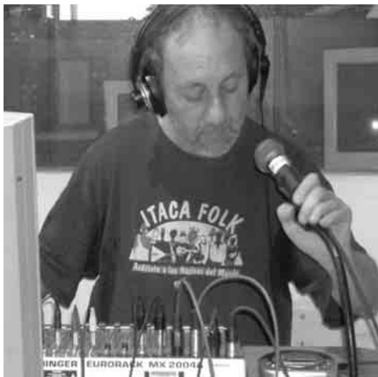
Radio Kalimera será unha das estações presentes na emissão

As rádios operarán em directo num espaço habilitado polo Cámara Municipal de Oleiros, a partir das cinco da tarde e até as dez da noite, participando de maneira activa no festival e emitindo em tempo real para toda a Galiza sobre tudo o que acontecerá no festival. A equipa técnica será cedida durante cinco horas pola rádio de Oleiros e quase todas as rádios livres aderíron já à proposta. Ademais, cada unha dará a conhecer a sua programação semanal, o seu trabalho e porán material à venda.