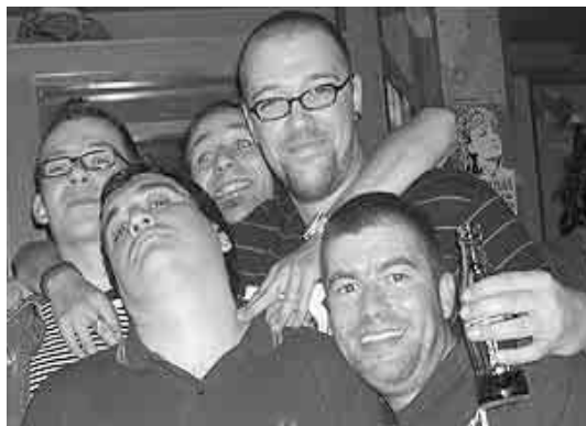
Todos os temas som de The Homens e tenhem copyleft

Penso que sim, e graças, fundamentalmente, à tecnologia. Há dez anos, quando estava em Fame Neghra, editar um disco era umha odisseia. Endividar-se até as orelhas ou, por um milagre, encontrar quem o levasse à rua. Agora, nós penduramos as cançons na nossa página na rede e, apesar de termos publicado o disco – polo aquele físico do disco, nom é? –, temos essa plataforma que nos está a ajudar