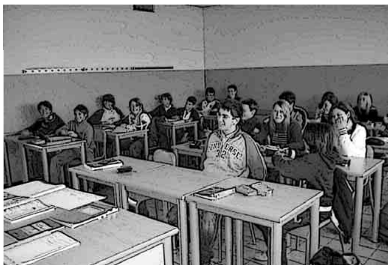
Assiste-se a uma mutação do modelo, em reajustamento segundo os vaivéns das crises e dos interesses do capital; que obriga a enfraquecer e a eliminar as condições que limitem a expansão dos benefícios dos grupos detentores da riqueza

Assiste-se a uma mutação de envergadura do modelo, reorientando-o a um reajustamento permanente segundo os vaivéns das crises e dos interesses do capital; reajustamento que obriga a enfraquecer e a eliminar todas as condições que limitem a expansão dos benefícios dos grupos detentores da riqueza. O domínio da economia situa-se no centro da vida individual e colectiva.