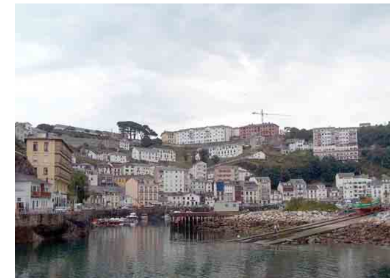
As câmaras municipais encontram nestas operações umha forma de mitigar a suas precárias situações económicas. O último informe do Observatório da Habitação denomina este fenómeno como "urbanismo financeiro"

Para fazer frente a esta situação começam a surgir movimentos cidadãos organizados que pretendem denunciar muitas das aberrações