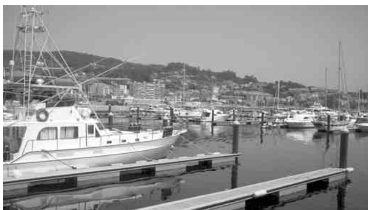
Em cima, urbanização prevista e denunciada no litoral de Ponte d'Eume. Na fotografia inferior, porto desportivo de Sam Genjo, modelo de cidade que começa a proliferar nos desenhos dos PGOM's de numerosas localidades