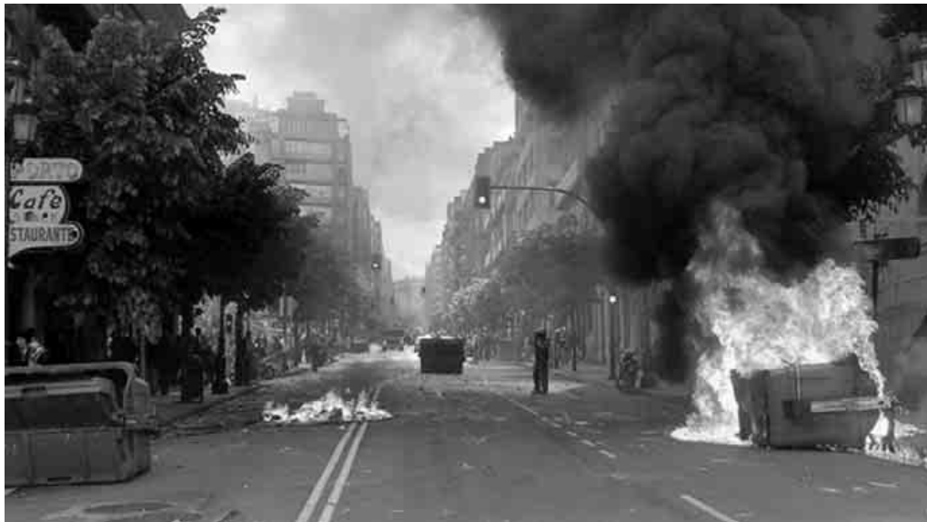
As trabalhadoras e os trabalhadores levantáram barricadas de lume no centro de Vigo para se defender da agressão policial

nárias, mobilizações de rua, negociações com o patronato, sabotagens e confrontos com as unidades de intervenção da polícia espanhola. Como culminação, um acordo tremendamente discutido. E como pano de fundo, uma nova reforma laboral recebida socialmente com o silêncio mais estrepitoso.