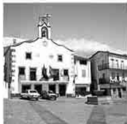
Val Verde do Freixo