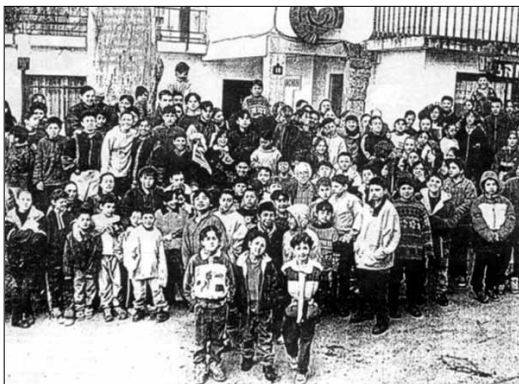
Imagem da fundação de Bemposta, comunidade humana com fins solidários criada em 1956.

No dia 29 de Novembro do ano 1999 a Junta assina un convénio em Santiago de Compostela em que participam a Conselharía da Economía e Fazenda, a Conselharía da Política Territorial, o Instituto Galego de Vivenda e Solo, a Cámara Municipal de Ourense e Gestom Urbanística de Ourense, S.A. para a transferência do campo de futebol de Ourense, com loteação para cerca de 10.000 pessoas, ao lote comprado em Bem-Posta. Um projecto urbanístico que inclui a