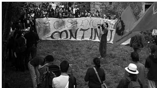
Acima, imagem do despejo da Casa Encantada. Abaixo, manifestação que concluiu com a ocupação de umha nova casa em ruínas, situada no bairro de Belvis.