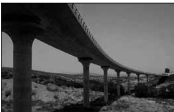
A auto-estrada danará gravemente o espazo de alto valor ambiental

O traçado da auto-estrada Lugo-Santiago, que propom e impom o Ministério do Fomento, discorre a escasos metros do castelo de Pambre e dana a paisagem da única testemuña arquitectónica da Galiza sobrevida ás revoltas irmandinas. Com o río Ulha recém-nascido, o asfalto algará as torrentes de Maciara, queda natural do curso fluvial com bosques de ribeira e ecossistema próprio ainda virgens. Ao se anunciar a construción da auto-estrada, na Junta desamporamos un projecto de minicentral eléctrica elaborado há mais de cinco anos para o lugar e levárom a concurso a licenza para construción.