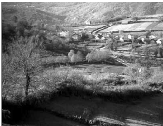
A comarca e a parquia nom som mais do que entidades simbólicas para a ordenação territorial da Junta, apoiada no modelo provincial desenhado por Javier de Burgos em 1833.

cidadania e destinada à gestom urbanística, e ainda tencionando acabar com a divisom em provincias, já que é "umha invençom espanhola".