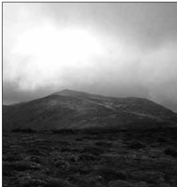
Situado na Cabreira, o Pico da Égua é o mais alto do País, com 2.143 metros de altura.

Comunidade Autónoma Galega. "Este pico está em Castrillo, na comarca da Cabreira, e hoje non é reconhecido como próprio". Este factor tem a ver com "um aspecto simbólico e psicosocial importante", em referência ao "necessário conhecimento da geografia galega", destacando que a ordenação e a delimitação territorial som aspectos fundamentais para o País.