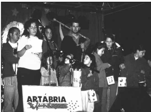
O Festival da Terra e da Língua consolidou-se como un dos mellores referentes da cultura e da festa galega.

Associação do Desporto Rural Galiciano, entidade pioneira que se centra no estudo e padronización dos desportos rurais e que aspira a generalizar e introducir estas actividades nas vilas e cidades galegas. As modalidades pra-