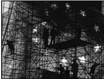
A "contração europea" agacha unha realidade ben diferente á proclamada

capita média de 30% da comunitária, provocará unha queda notável desta última, e aínda un aumento artificial da renda nas regions "objetivo 1". O trabalho de análise aponta que mesmo neste cenário a Galiza mantería unha renda média inferior a 75% da renda de unha UE com 25 membros, e portanto continuaría a ser receptora dos Fondos Estruturais.