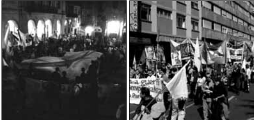
À esquerda, rondalla da mocidade coa bandeira celebrada no 24 de Julio polo AMI. À dereita, mobilización de NÓS-UP o 25 de Julio.

A Asemblea da Mocidade Independentista prosegue con a súa combinación de proposta política e lúdica para a véspera do 25. Con a legenda "Ganhemos o futuro, defendamos a Galiza", convoca á juventude combativa do País a unha nova rondalla da bandeira; a música tradicional acompañará a defensa e difusión da simboloxía nacional e a colocación de faixas reivindicativas en algúns dos máis coñecidos prédios históricos da cidade. A partir da media noite, dará comezo un concerto na céntrica Praza de Maçarelos cos grupos Meninos da Rua, Skármio e varios DJs.