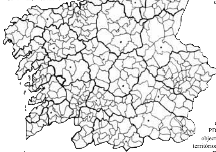
Mapa da Fundação Carvalho Calero

o artigo 40.2 estabelece que por meio de unha lei "a Comunidade Autónoma poderá reconhecer a comarca como entidade local com personalidade jurídica e demarcação próprias". A comarcalização institucional promovida pola Junta começou a realizar-se a partir do Plano de Desenvolvimento Comarcal (PDC), aprovado definitivamente em 1991 e concebido como "um instrumento integrador da acção das diferentes administrações públicas implicadas nas áreas comarcais prefixadas". Os objecti-