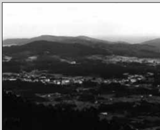
As 19 paróquias do Vale do Ouro formam um conjunto integrado

Prudencio Viveiro Mogo Historiador e militante do BNG